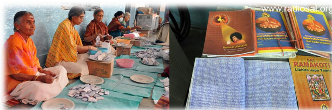
Mit Seinem Namen auf den Lippen gehen die selbstlosen freiwilligen Helfer still ihrem großen Dienst nach (links). Likhita Japa (das Schreiben Seines Heiligen Namens) Hefte aus der ganzen Welt landen in Prasanthi, damit deren Seiten als Verpackungsmaterial für Vibhuti dienen (rechts).

„Dies ist etwas, das wir für Swami tun wollen. Wie könnten wir dafür Geld annehmen?“