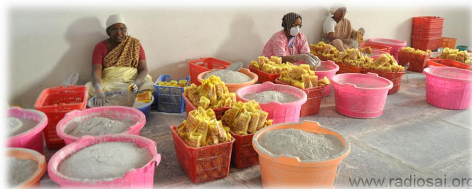
Die Helferinnen des Herrn bei der Arbeit, damit das höchst geschätzte Zeichen von Swamis Gnade das Heim jedes/jeder Devotee(s) bis in alle Winkel des Globus erreicht.

Doch auch der Verpackungsprozess hat sich über zwei Jahrzehnte hinweg weiter entwickelt. 1986 bestand die Originalverpackung aus einer gelben Papiertüte, in die die Vibhuti gefüllt wurde. Um das Eindringen von Feuchtigkeit und Verklumpen der Asche zu verhindern, wurde anschließend die Papierverpackung mit einer gelblichen transparenten Kunststoffolie umhüllt. Verschlossen wurde das Ganze dann mit einem dünnen weißen Zwirn. Diese aufwändige Art der Verpackung war sehr arbeitsintensiv.