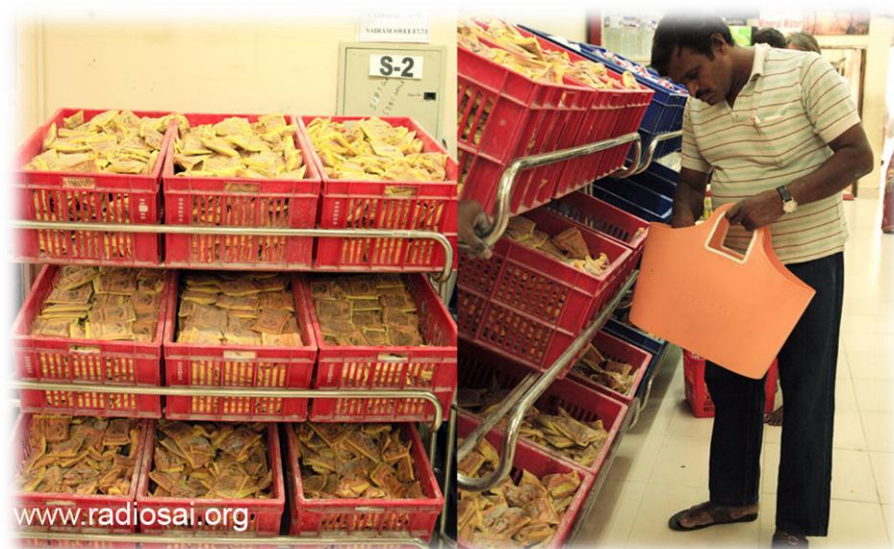
Die Abteilung des Einkaufszentrums in Prasanthi Nilayam, die kein Geld verdient, dafür aber mit überreichem Segen und guten Wünschen der Devotees bedacht wird!

Können Sie raten, welche Menge an Vibhuti in einem Jahr Prasanthi Nilayam verlässt? Hören Sie auf zu lesen – schließen Sie ihre Augen – und machen Sie eine grobe Schätzung. Als ich dies tat, dachte ich, die Läden würden etwa 5.000 kg Vibhuti pro Jahr verkaufen. Doch die tatsächliche Menge verschlug mir die Sprache. Durchschnittlich werden pro Jahr etwa 100 Tonnen Vibhuti ausgeliefert – ganze 100.000 kg. In der Tat kletterte diese Zahl im Jahr 2010 bis auf 128.000 kg! Und man bedenke – die gesamte Menge wird ausschließlich von freiwilligen Mitarbeitern - im Durchschnitt 20 Frauen - von A bis Z, d. h. von der Fertigung bis zum Verkauf, verarbeitet und verpackt!