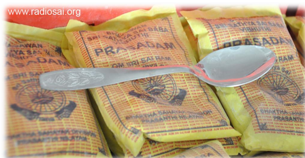
Der gesegnete Löffel, der bis zum heutigen Tag zum Dosieren der verschiedenen Duftstoffe für die „perfekte Rezeptur“ verwendet wird.

Zwei feste und zwei flüssige Duftstoffe wurden aus Dutzenden ausgewählt, die Khialdas zu Swami gebracht hatte. Swami rief Bujamma zu sich und gab ihr Instruktionen, jeweils einige Teelöffel sowohl der flüssigen wie auch der festen Duftstoffe in 40 Säcke der geruchlosen Vibhuti aus Palani zu mischen. (Das exakte Mischverhältnis wird nicht verraten. Die exakte Formel ist ein Geheimnis, welches wie die berühmte „Coca-Cola Rezeptur“ gehütet wird. Das Mischverhältnis wird nur mündlich weitergegeben, aber nirgendwo niedergeschrieben). Auf diese Weise werden mittels einiger Gramm Duftstoffe 2000 kg Vibhuti hergestellt. Die Bezeichnung „einige Gramm“ ist korrekt, da selbst heute dieselben Messlöffel verwendet werden. Für die Proportionierung kommen keine elektronischen Waagen zum Einsatz!