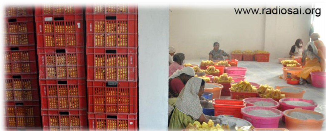
Eine Wand in der „Produktionshalle“ trennt die aktuelle Herstellung von dem bereits abgepackten „Gut“.